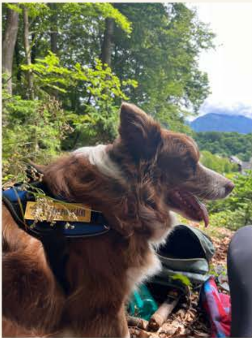
Amy v gozdu