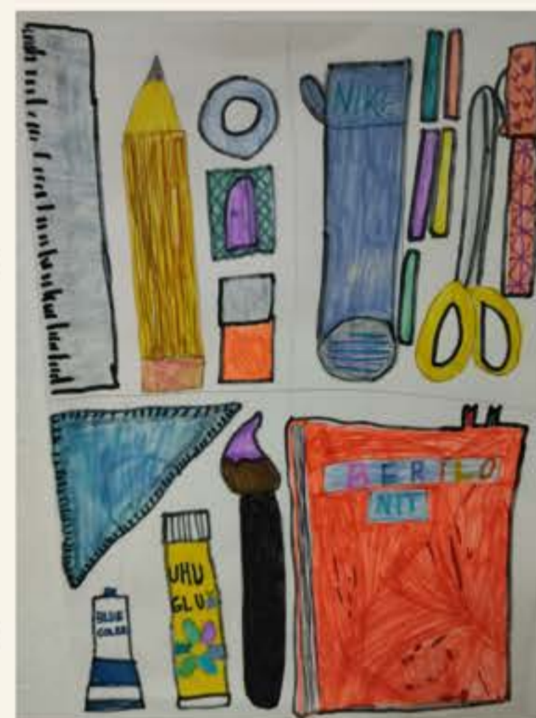
Pavla Kranjčič, 5. M