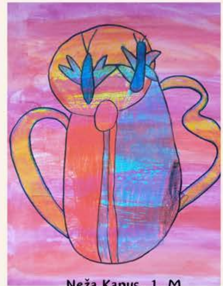
Neža Kapus, 1. M