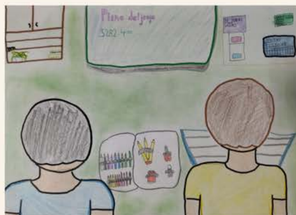
Tevž Rožič, 5. M