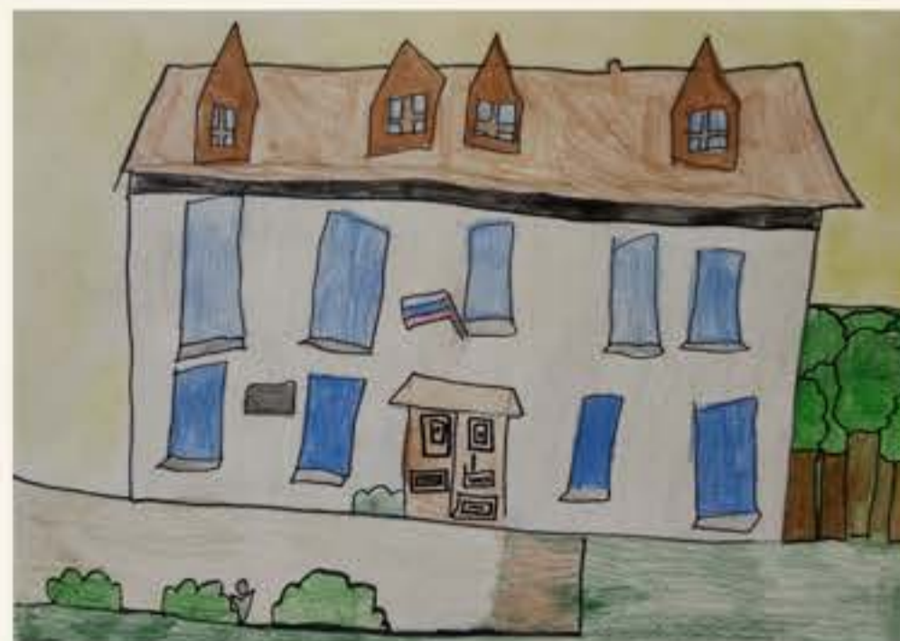
Pia Križaj, 4. M