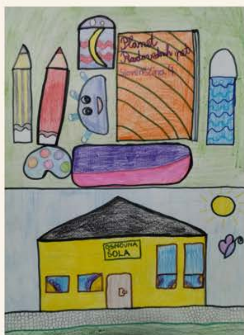
Zala Tajmer, 5. M