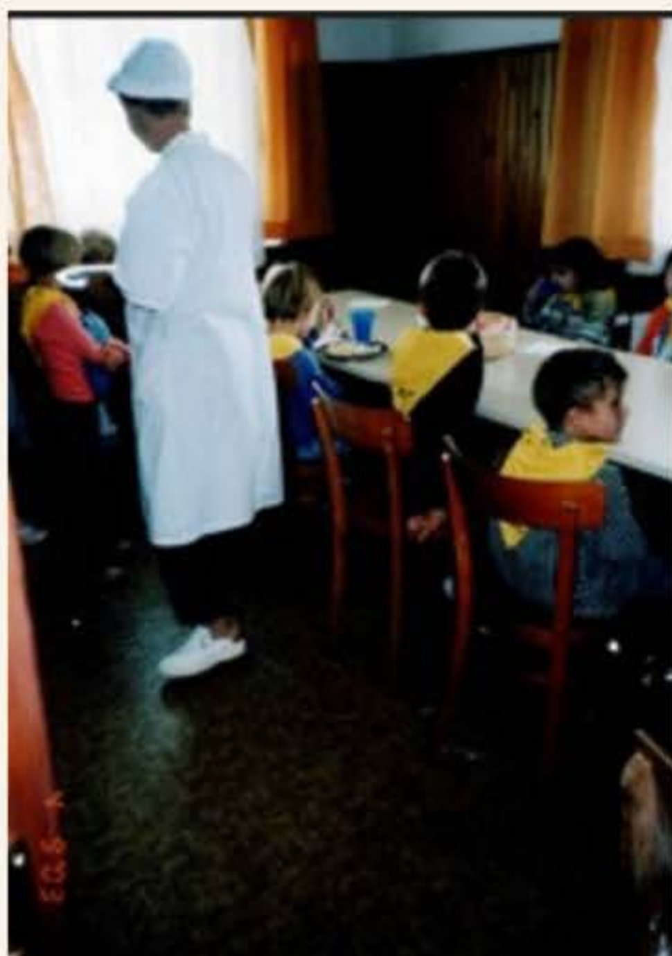
učenci med malico