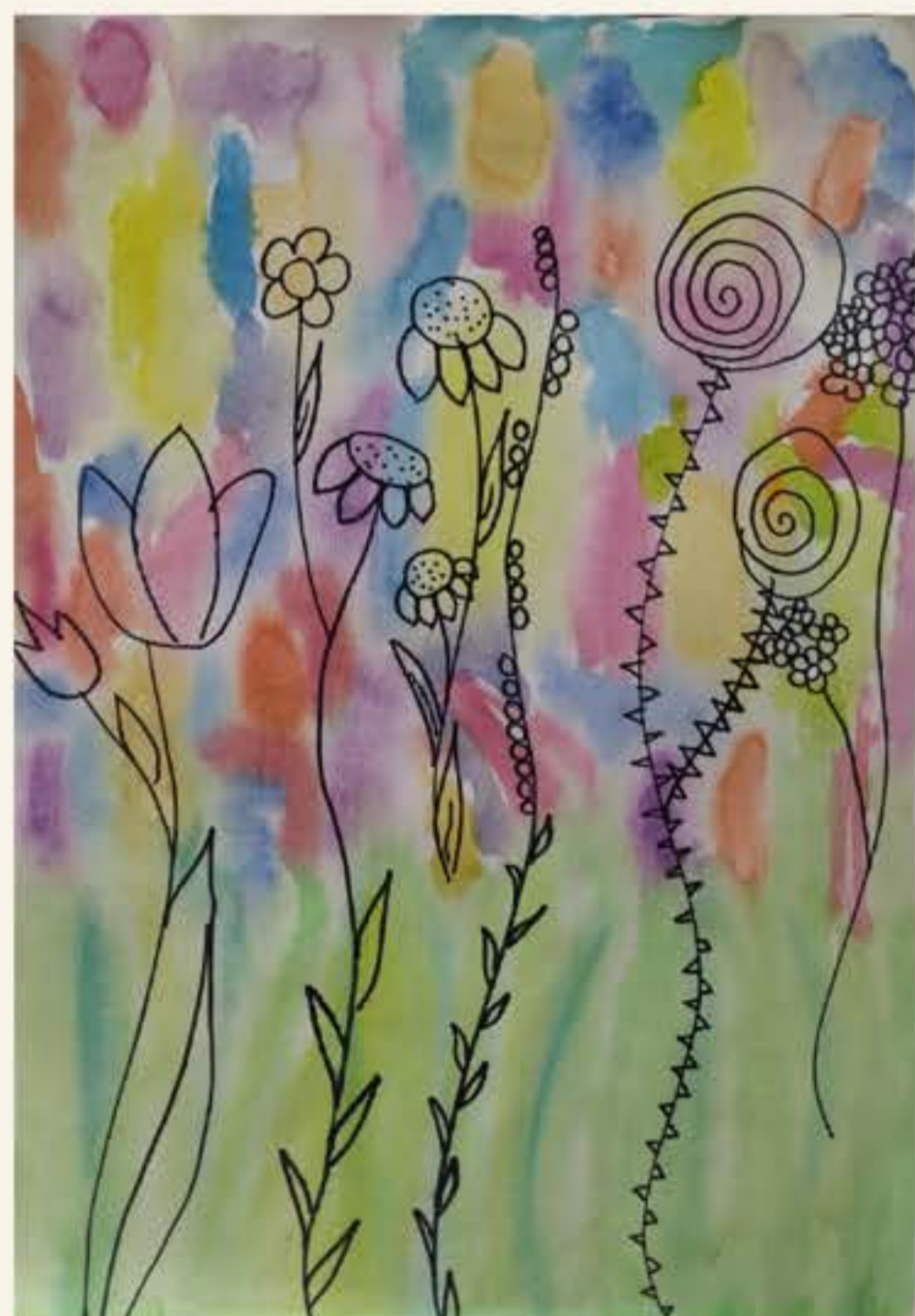
Lina Mordej, 5. M