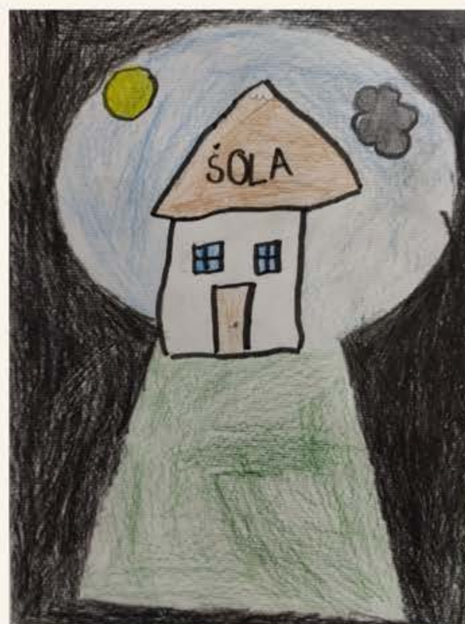
Izabella Lovrec Kavčič, 2. M