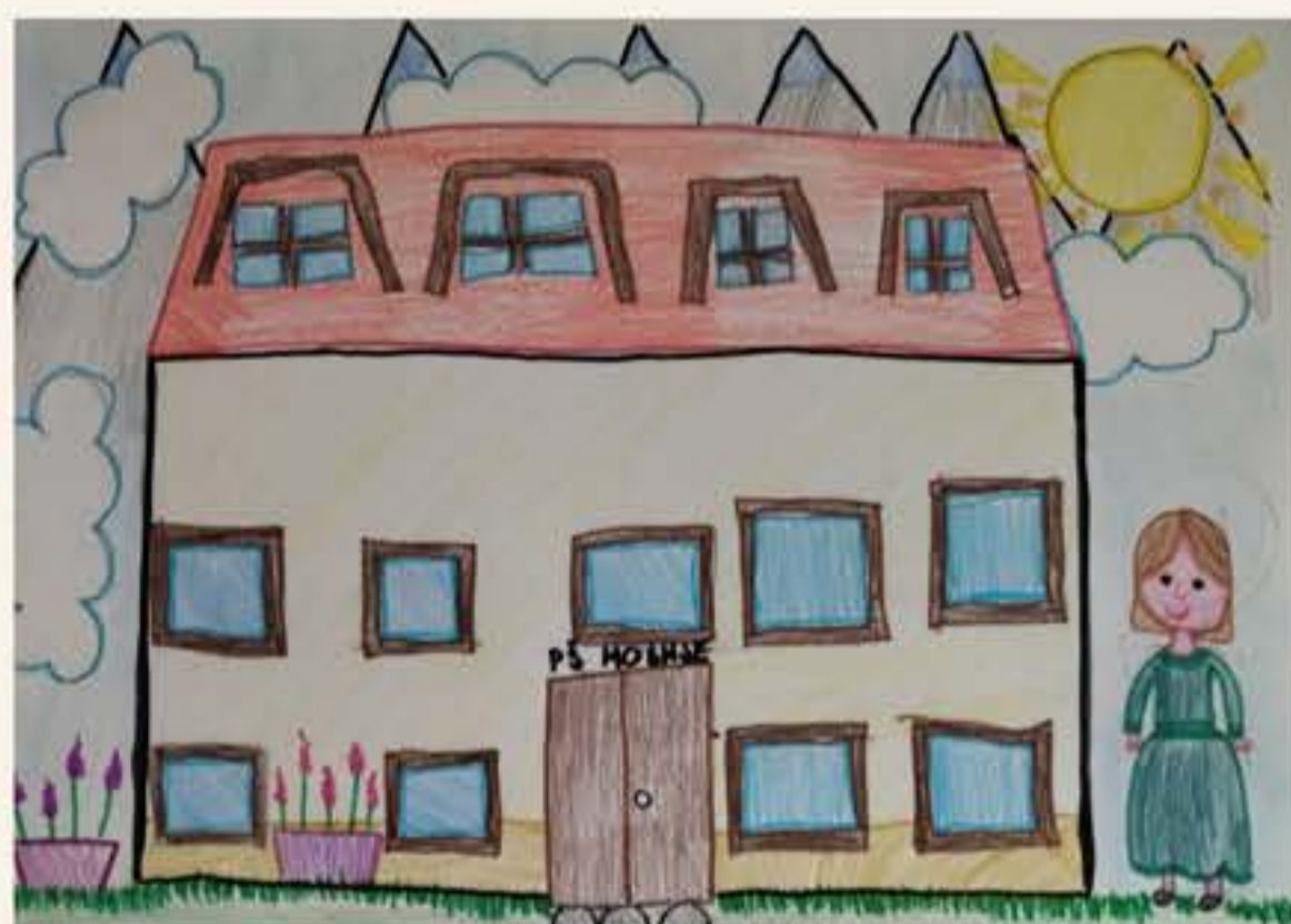
Lina Mordej, 5. M