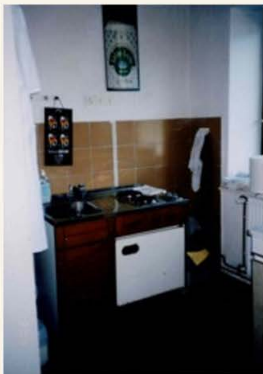
kuhinja v času izgradnje mansarde