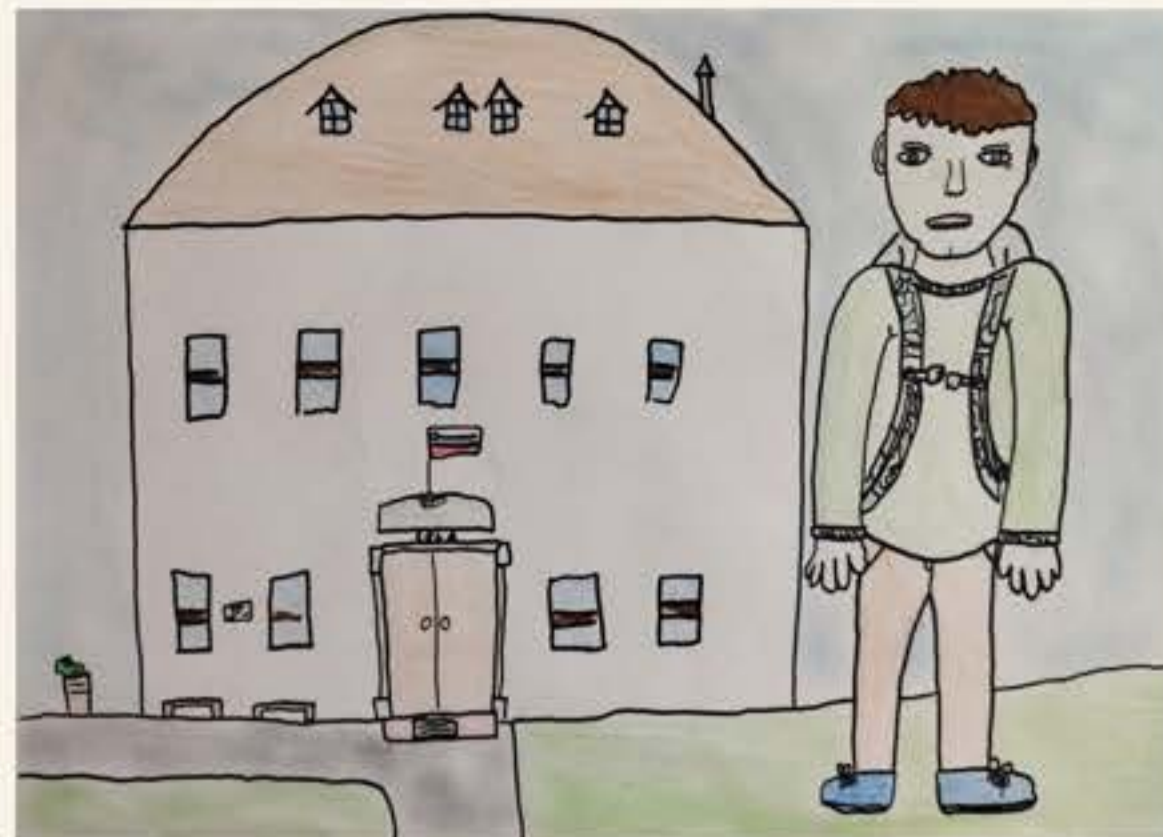
Nik Novšak, 5. M

Ko sem prvič prišel v to šolo, sem se počutil zelo dobro, ker sem spoznal nove sošolce in sošolke. Spoznal sem tudi druge otroke iz naše šole. Sedaj pa poznam že skoraj vse in se z njimi zelo dobro razumem.