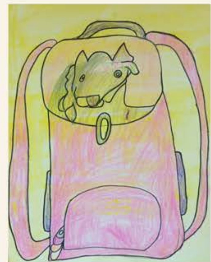
Tinkara Zupan, 1. M