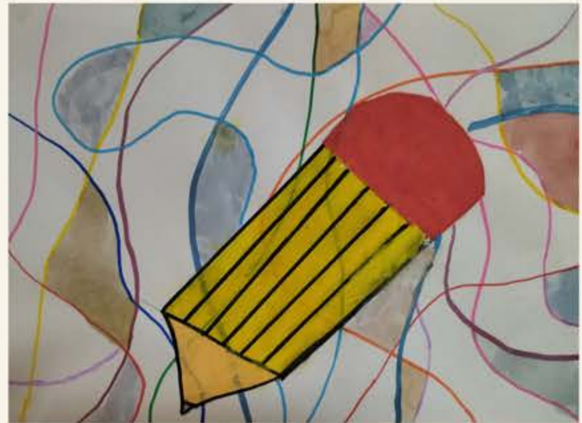
Andraž Pintar, 5. M