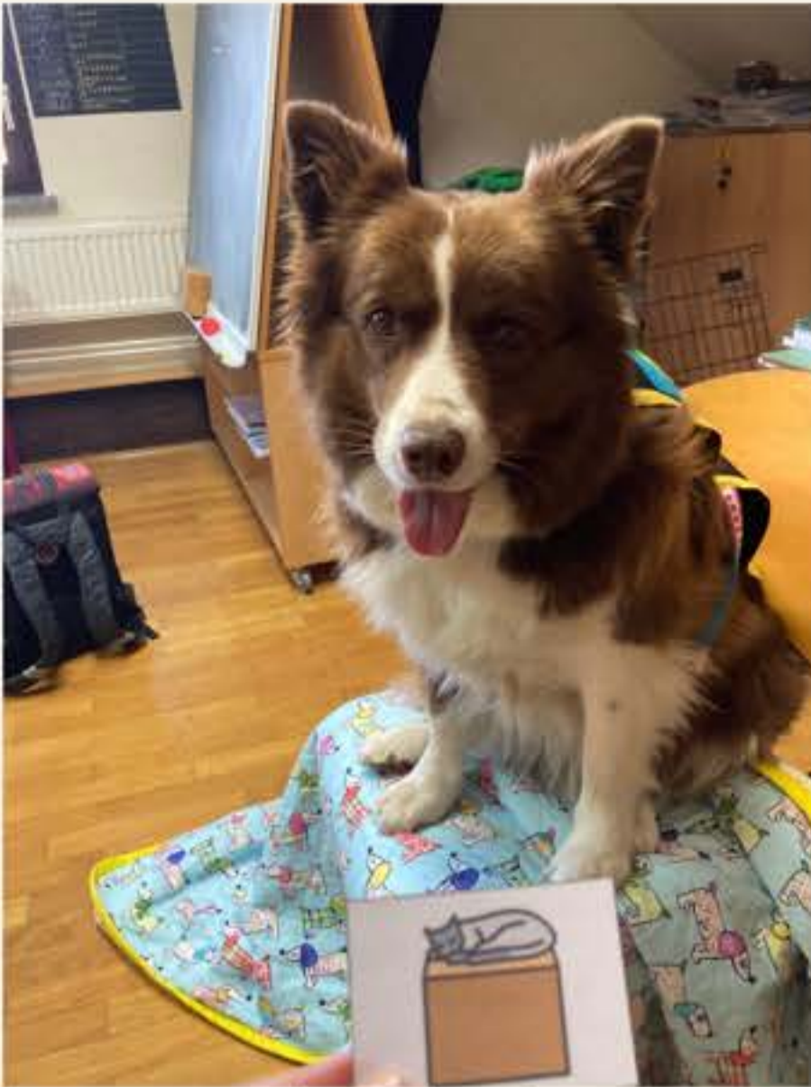
Amy pri pouku