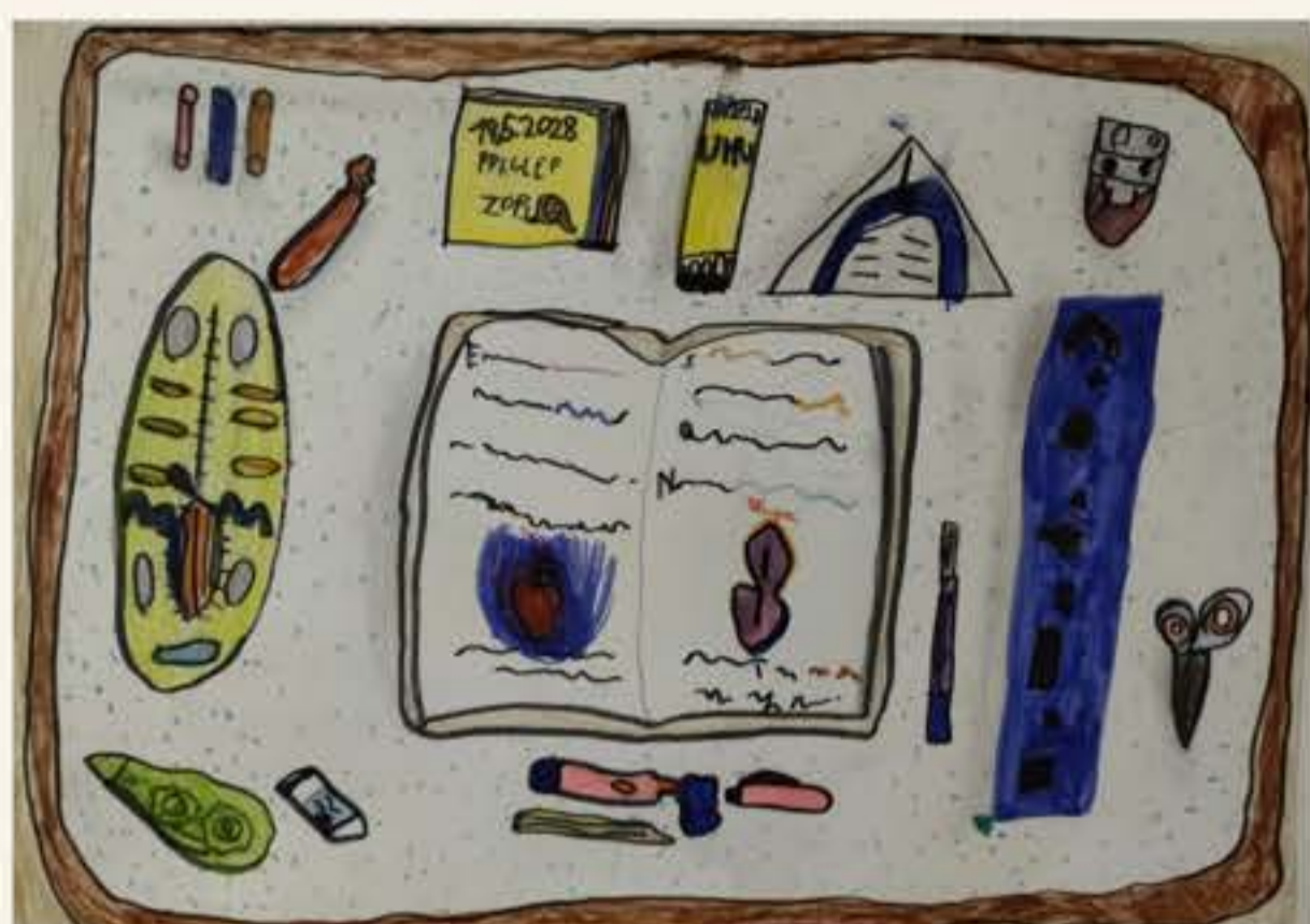
Rebeka Hüll, 5. M