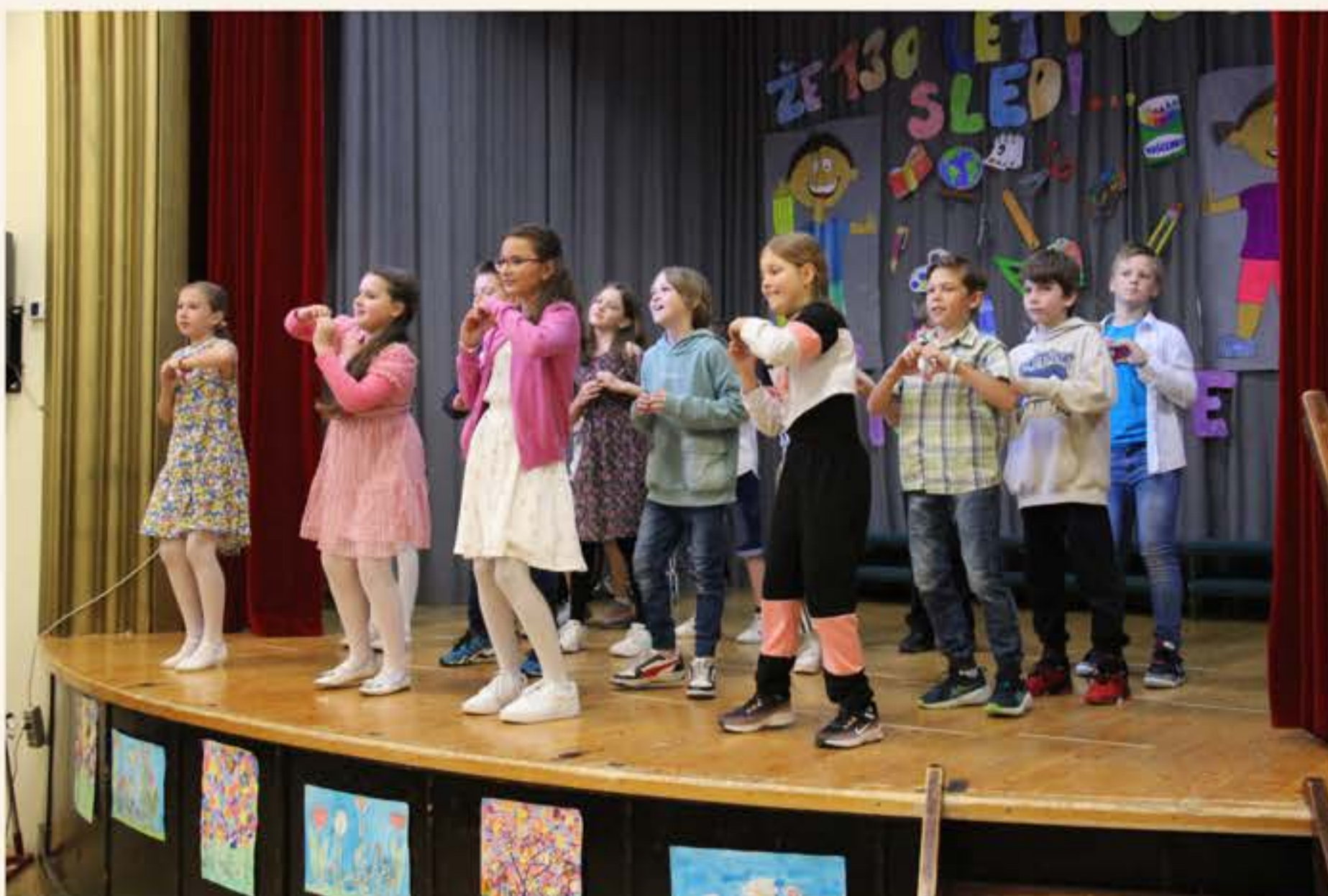
Učenci 4. razreda so zaplesali na skladbo Pusti soncu v srce.