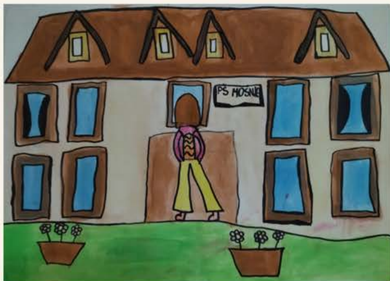
Zala Tajmer, 5. M

Ko sem prišel v 1. razred, se mi je šola zdela zelo težka, potem pa je bilo vedno lažje. Moj najljubši predmet je šport. Pri športu se najraje igram med dvema ognjema.