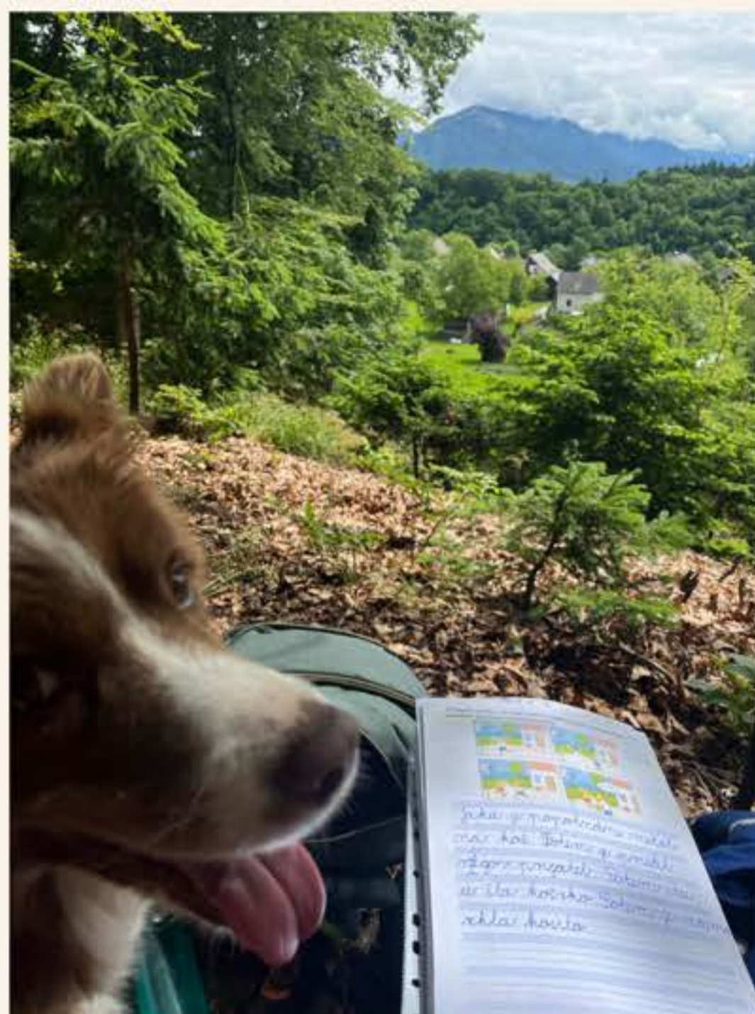
pouk v gozdu