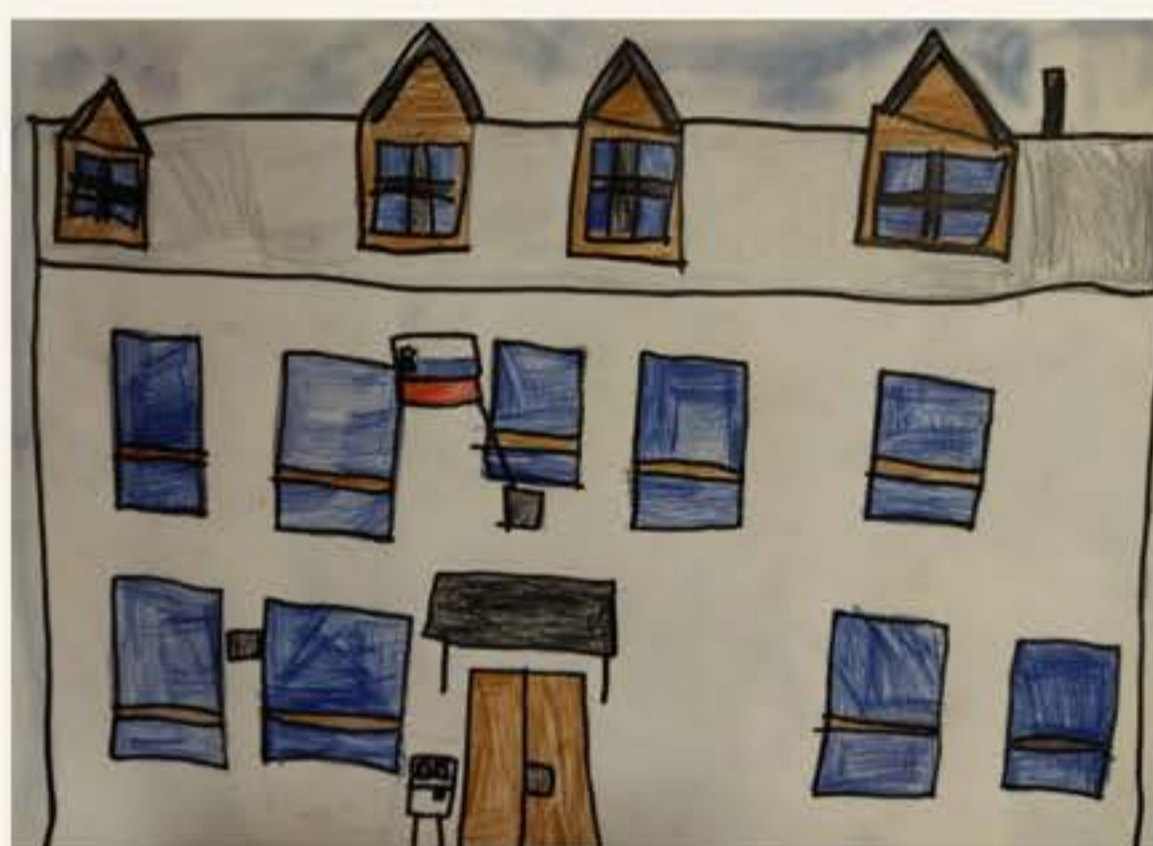
Žan Bremec, 4. M