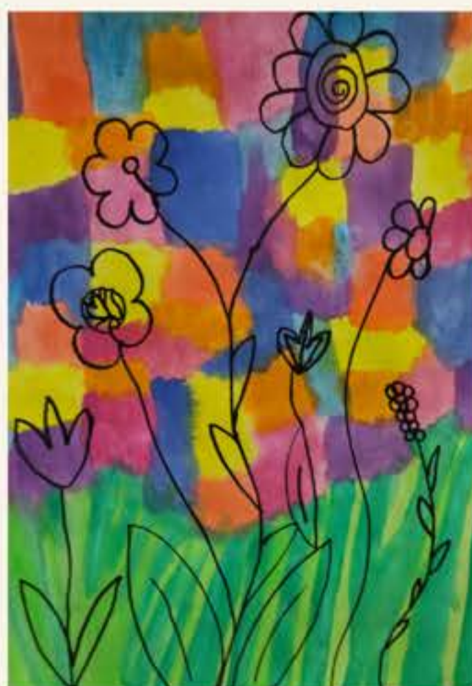
Zala Tajmer, 5. M

vodja PŠ Mošnje in učiteljica 3. razreda PŠ Mošnje