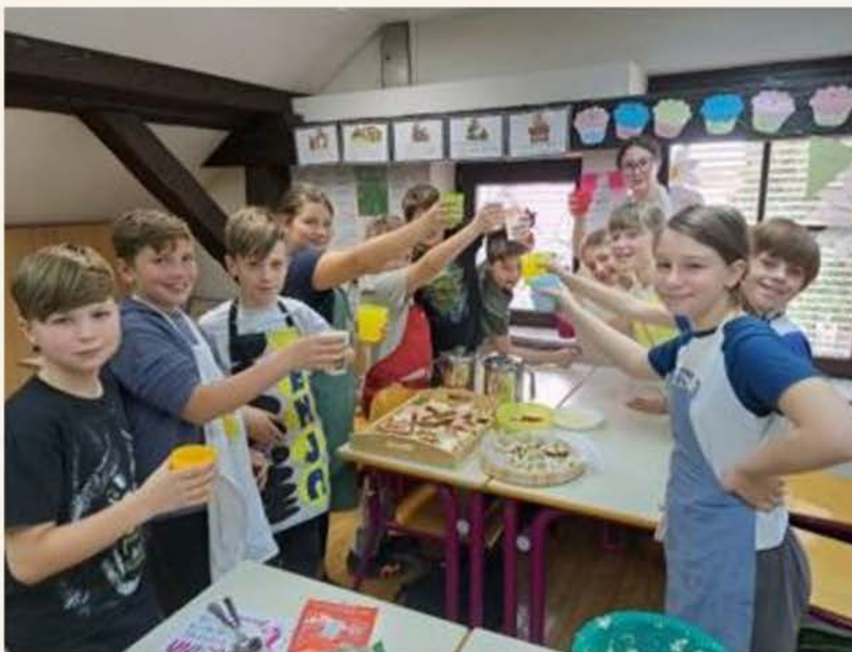
učenci 5. M razreda