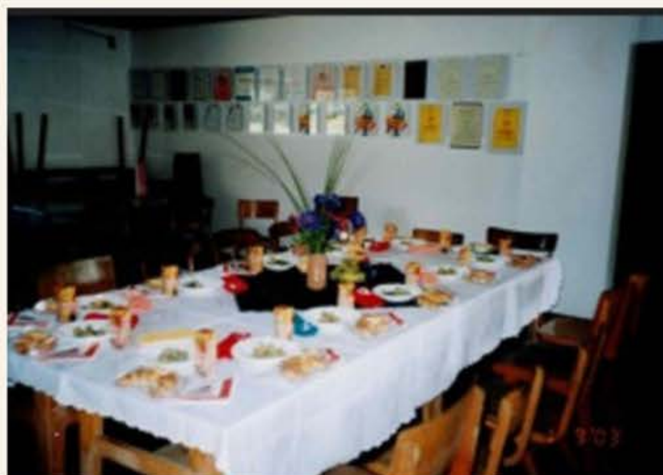
pogrinjek za nove prvošolce