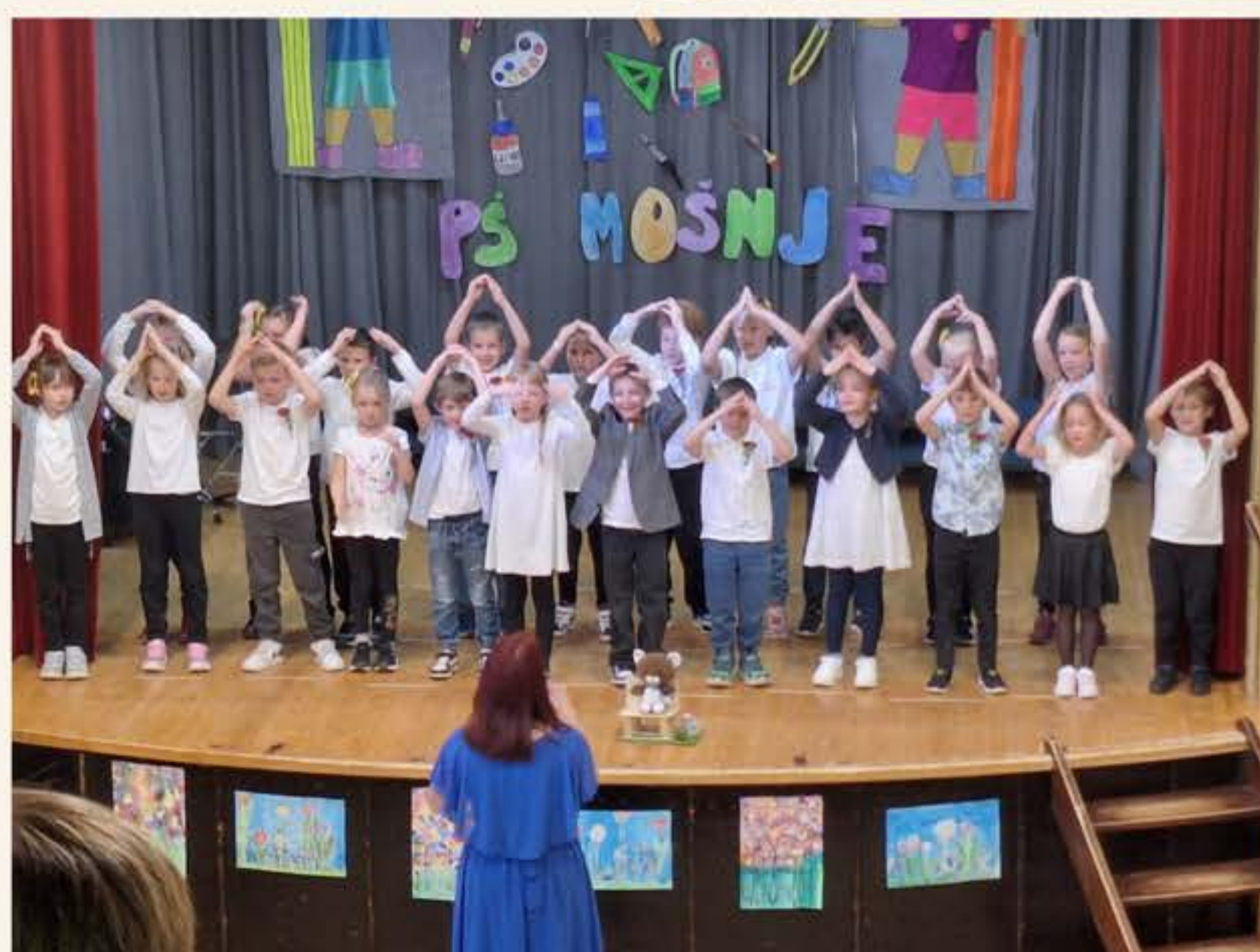
... in zapeli pesem Kajetana Koviča: Moj prijatelj Piki Jakob.