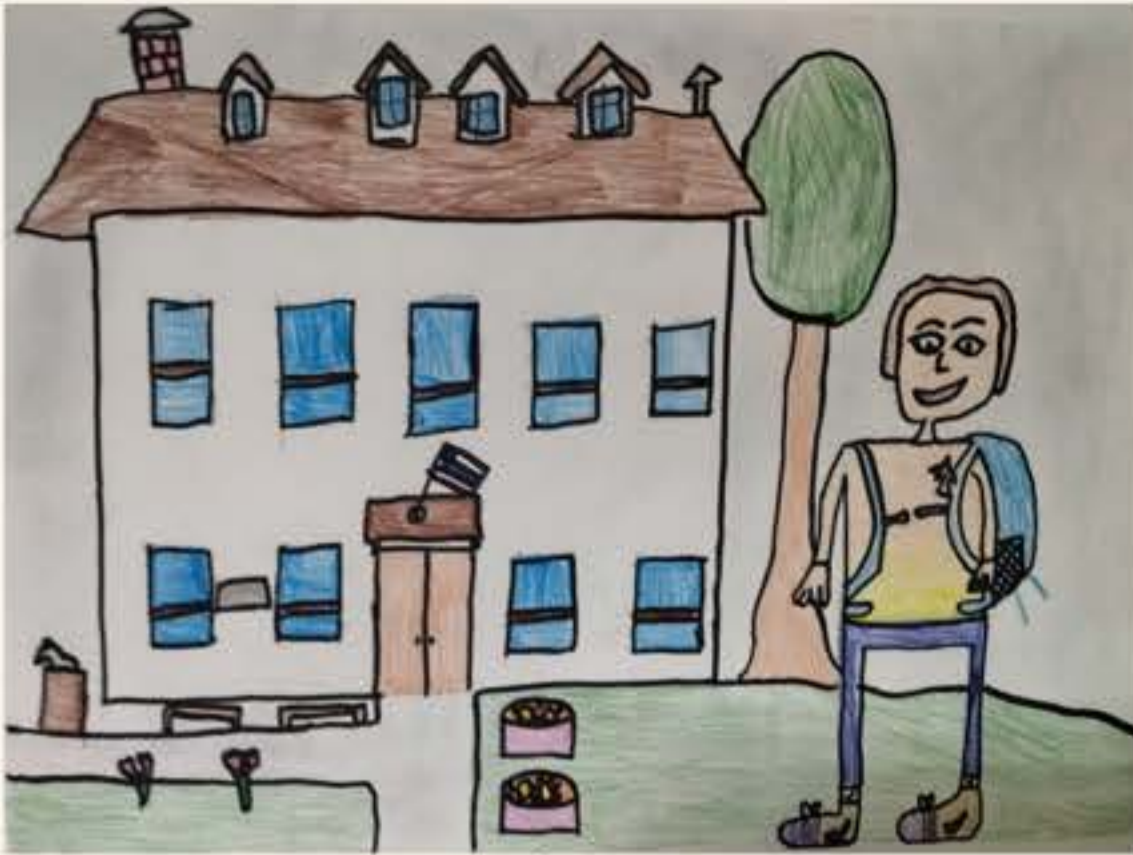
Svit Potočnik, 5. M