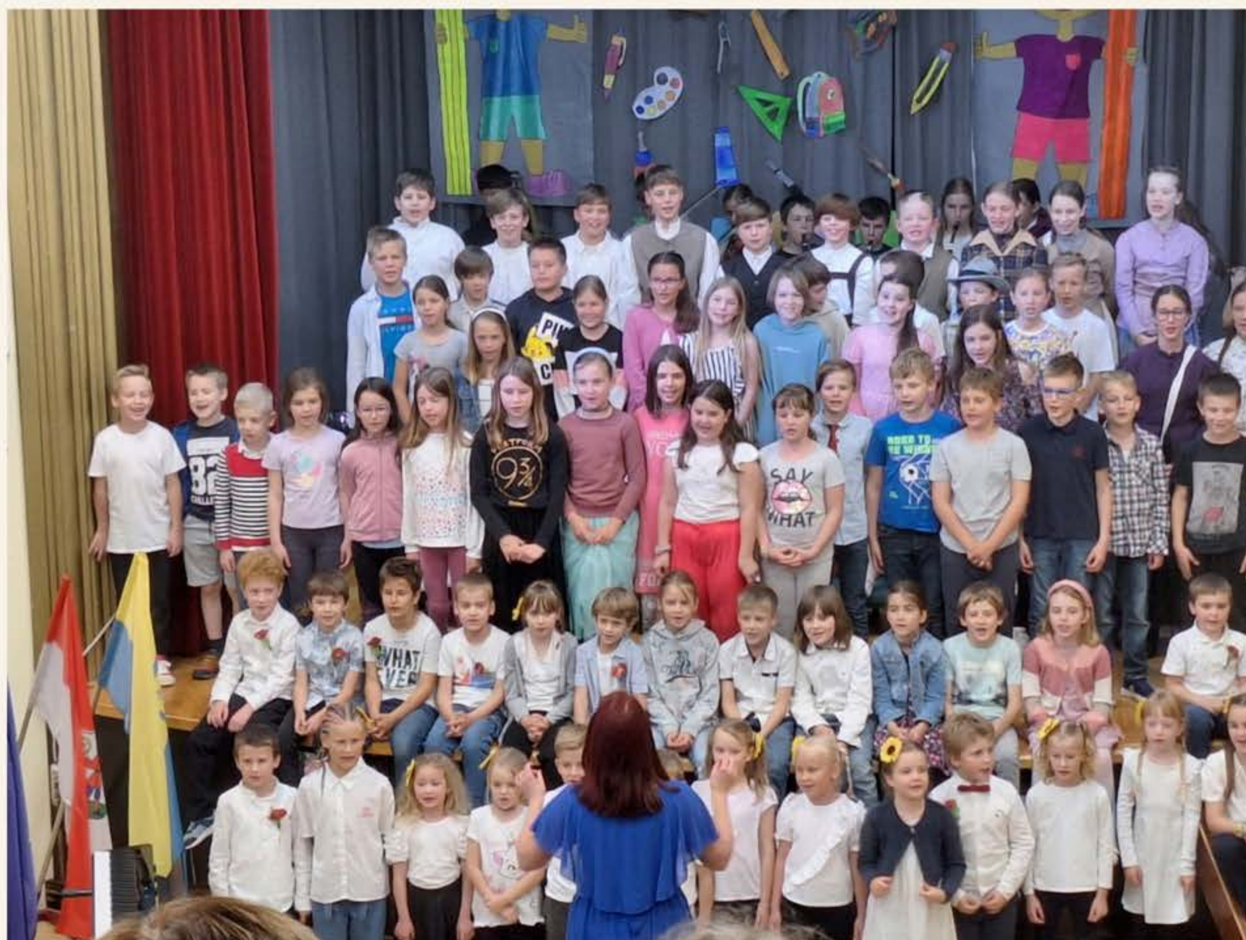
Za konec so vsi učenci naše šole z orkestrom naše matične šole zapeli še Kekčevo pesem.