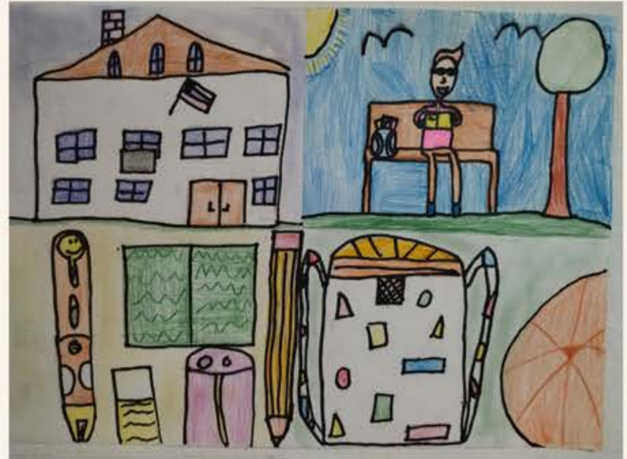
Svit Potočnik, 5. M