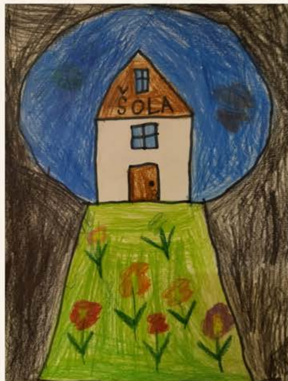
Lucija Cvenkelj in Lovro Markelj, 2. M

Urška Ambrožič, učiteljica 4. razreda PŠ Mošnje