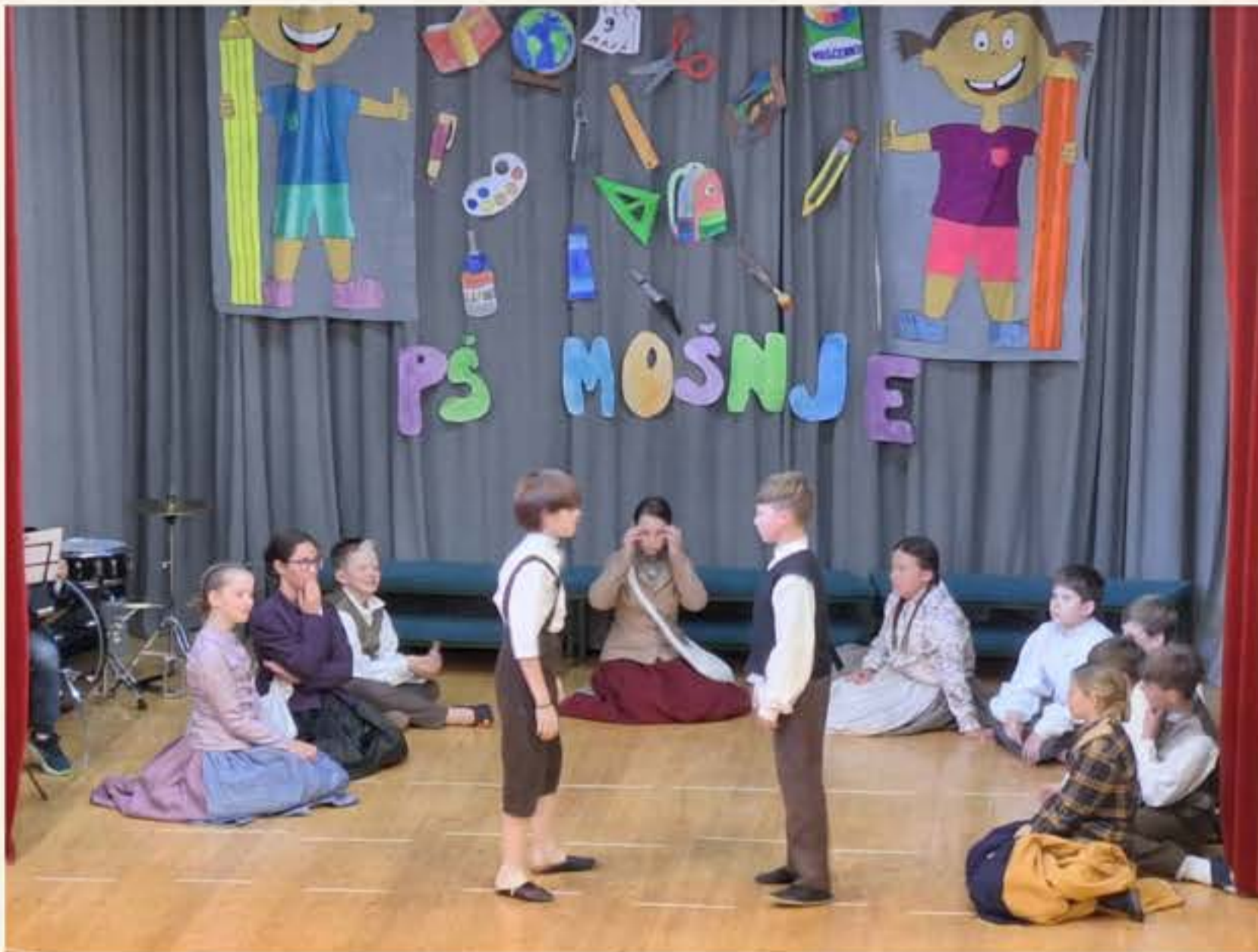
Učenci 5. razreda so se naučili ljudske plese in pesmi z naslovom Šolska je težka.