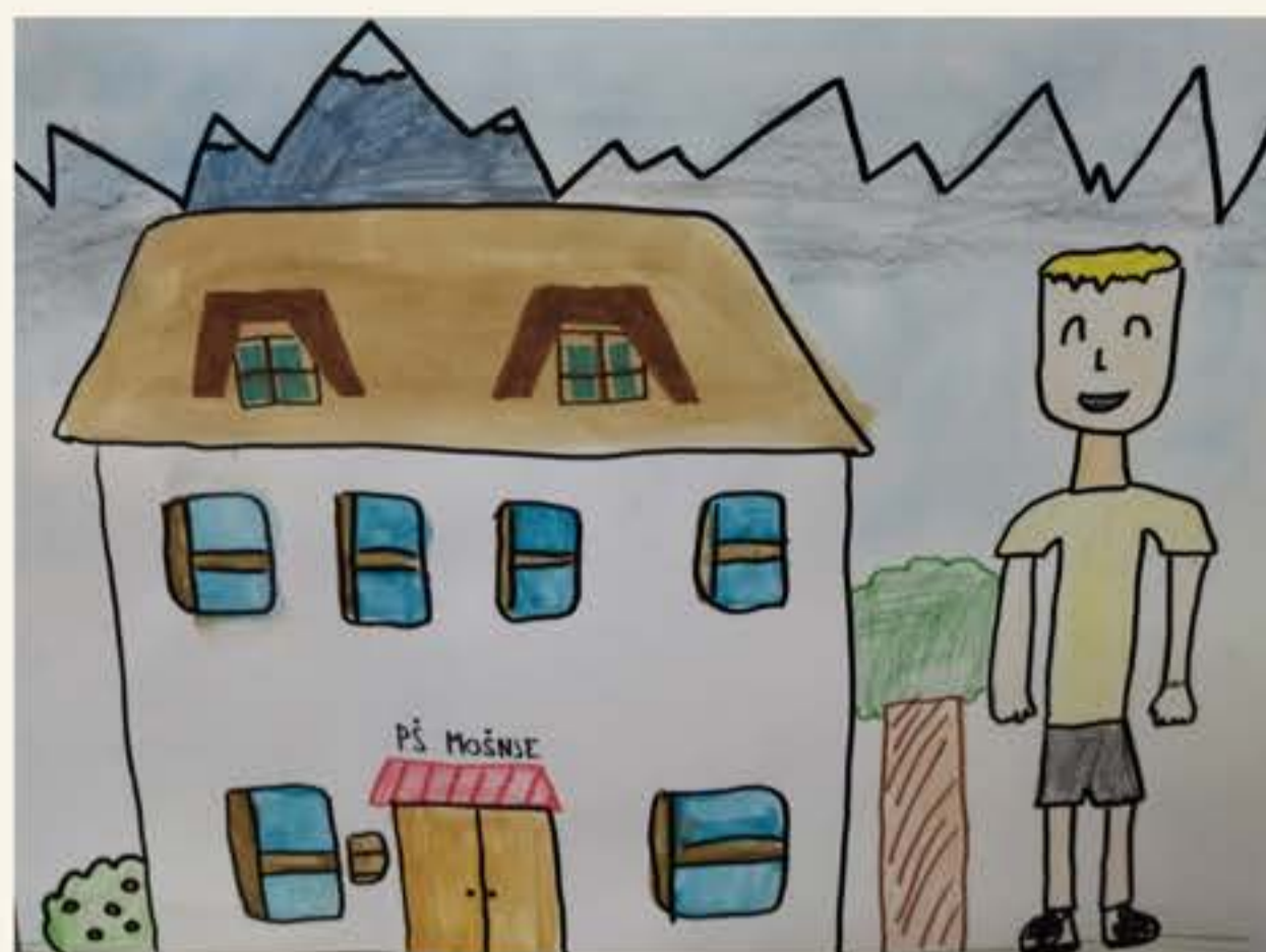
Tevž Rožič, 5. M

V šoli nabirajo si novih izkušenj, tako življenjskih kot tudi pravih preizkušenj. Hodijo na športne, kulturne, tehniške, naravoslovne dni, se tam sprostijo, zato jim čas res hitro beži.